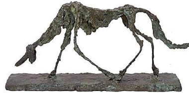
Le chien (1951)

Une sculpture n'est pas un objet, elle est une interrogation, une question, une réponse. Elle ne peut être ni finie, ni parfaite.