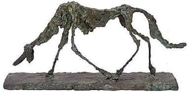
Le chien (1951)

Une sculpture n'est pas un objet, elle est une interrogation, une question, une réponse. Elle ne peut être ni finie, ni parfaite.